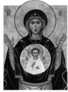
Ufficio Pastorale Vocazionale